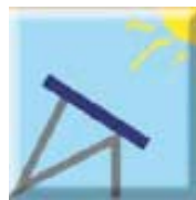
Schéma d'une structure de type console non éligible à la prime d'intégration au bâti

Les toitures, ardoises ou tuiles installées en surimposition à une structure ne sont pas éligibles. Ainsi, l'installation d'un panneau monté sur un toit terrasse sur une structure métallique, dite de « type console », ne peut être considérée comme de l'intégration au bâti.