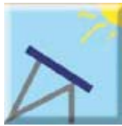
Schéma d'une structure de type console non éligible à la prime d'intégration au bâti

Les toitures, ardoises ou tuiles installées en surimposition à une structure ne sont pas éligibles. Ainsi, l'installation d'un panneau monté sur un toit terrasse sur une structure métallique, dite de « type console », ne peut être considérée comme de l'intégration au bâti.