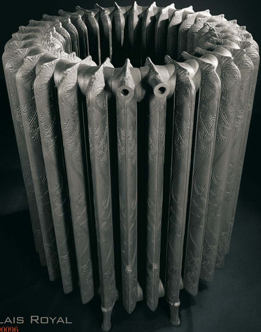
PALAIS ROYAL Réf. 90096