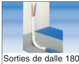
Sorties de dalle 180

Les accessoires indispensables pour des installations très esthétiques et répondant aux règles de l'art.