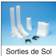
Sorties de Sol