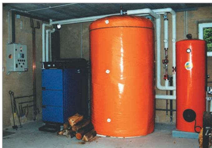
Vue d'une installation à hydroaccumulation