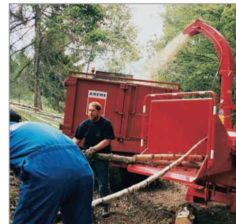
Broyage du bois.

Une maison bien isolée de 100m 2 consommera annuellement environ 15 à 20 MAP, soit environ 260€ de dépenses annuelles pour l'achat du combustible.