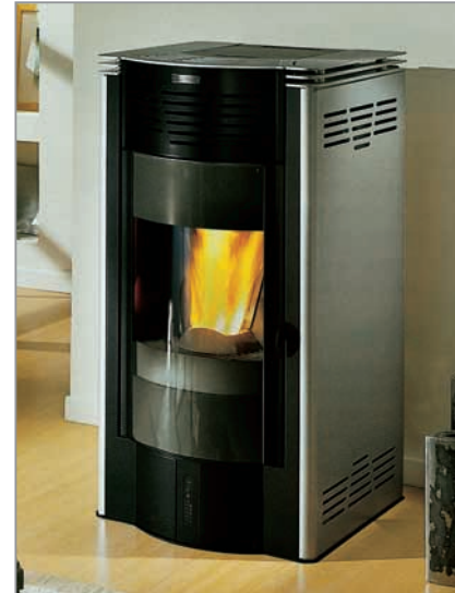
Vue d'un poêle à granulés

Le volume varie en fonction des possibilités autorisées par le site. Par ailleurs, le silo doit être parfaitement étanche.