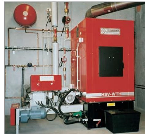
Vue d'une chaudière à alimentation automatique au bois

d'optimiser les coût d'installation tout en autorisant une autonomie de 1 à 3 jours en fonction de la température extérieure.