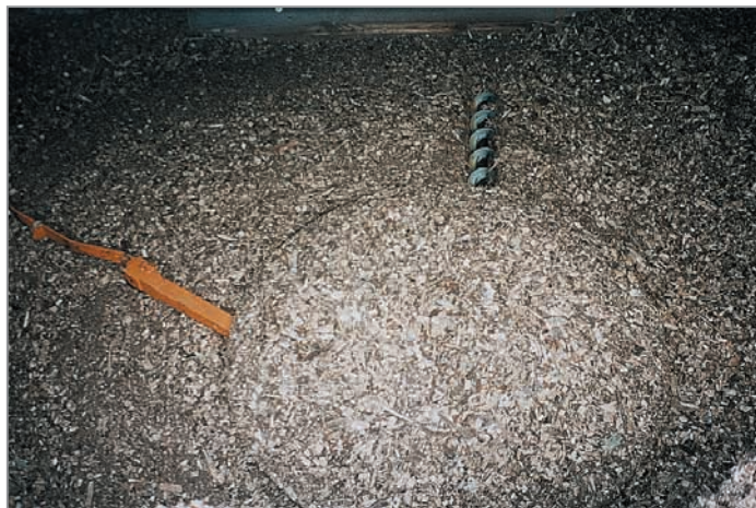
Silo de stockage des plaquettes de bois avec vis sans fin et bras articulés.