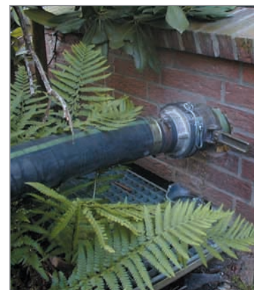
Livraison de granulés

L'investissement varie de 2000 à 4000€ pour un poêle à granulés et de 10000 à 16000€ pour une chaudière et son silo.