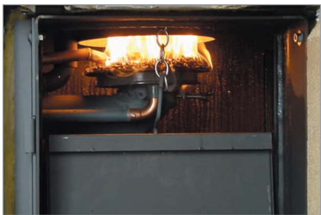
Vue du foyer de la chaudière.