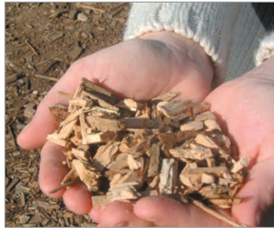
Plaquettes de bois

Aujourd'hui, les progrès techniques réalisés par les fabricants de chaudières bois font qu'il est possible d'avoir un chauffage complètement automatisé fonctionnant avec du bois sous forme de plaquettes ou de granulés. Cette fiche décrit la solution plaquette.